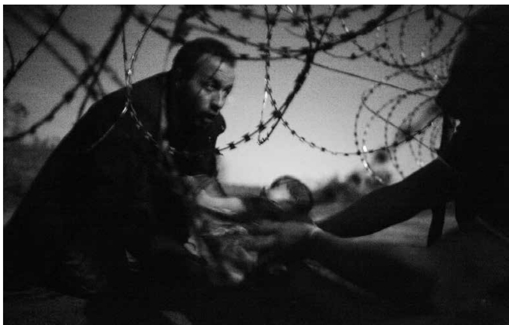
Zwycięzcą tegorocznego konkursu World Press Photo został Australijczyk Warren Richardson. Jury doceniło jego zdjęcie przedstawiające uchodźców na granicy Serbii i Węgier