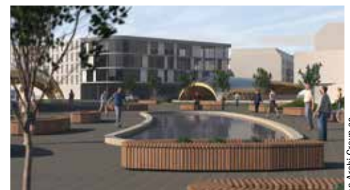
An Archi Group sc.