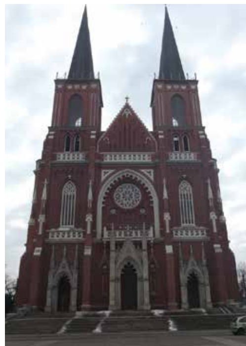
Bazylika archikatedralna pw. Świętej Rodziny

Pawła II. Stoi tam okazała neogotycka bazylika archikatedralna pw. Świętej Rodziny. Budowla wzniesiona w latach 1901-1927, wg projektu Konstantego Wojciechowskiego, jest trójnawowa, wykonana z czerwonej cegły elewacyjnej, z dwiema wieżami i wejściem głównym na osi pomiędzy wieżami. Wnętrze kryje monumentalny tryptyk Świętej Rodziny ołtarza głównego, wykonanego z lipowego drzewa w latach 50. ubiegłego wieku, wg projektu Zygmunta Gawlika. Później sukcesywnie uzupełniano wyposażenie kościoła, m.in. w witraże, ambonę, kaplice. Na chórze organowym w latach 1946-1949 ustawiono organy.