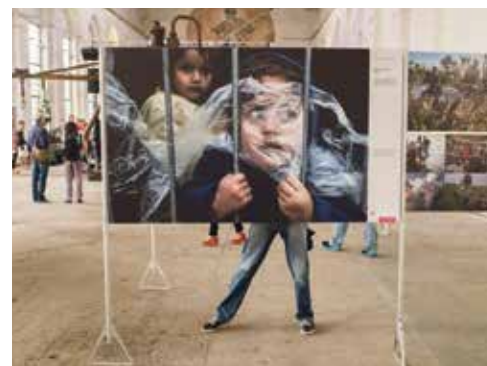
Chorzowską wystawę zorganizowano w postindustrialnej scenerii byłej elektrowni Huty Królewskiej