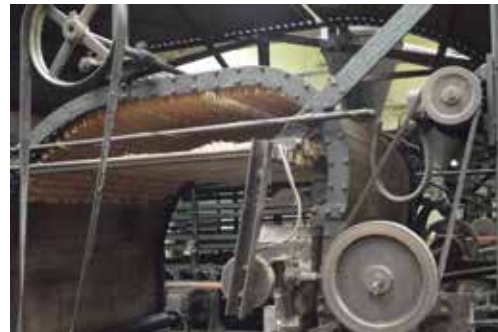
Muzeum Produkcji Zapalek

Tekst i zdjęcia: Adam Lapski Przewodnik turystyczny