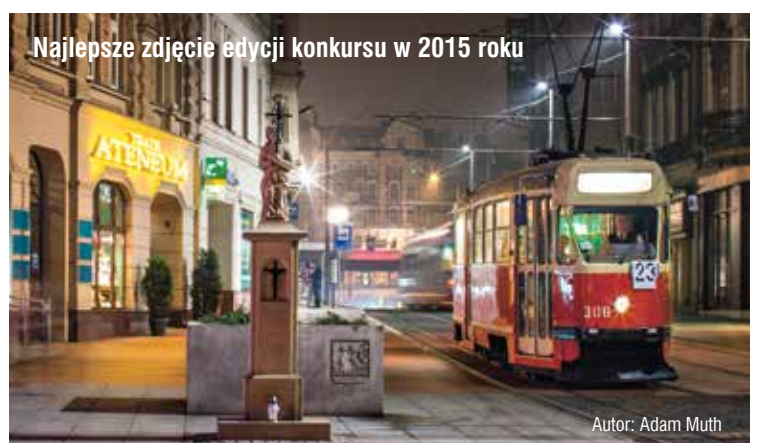
Najlepsze zdjęcie edycji konkursu w 2015 roku