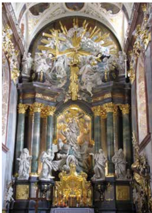
Ołtarz w bazylice jasnogórskiej