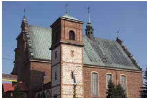
Kościół Podwyższenia Krzyża Świętego

Podczas pobytu w Częstochowie warto zajrzeć jeszcze do Muzeum Produkcji Zapalek przy ul. Ogrodowej 68, gdzie można zobaczyć czynną przedwojenną linię do produkcji zapalek i zwiedzając obiekt obserwować proces produkcji. Znajduje się tam również mini galeria etykiet i akcesoriów zapalczkarskich oraz zestaw miniaturowych, precyzyjnie wykonanych rzeźb z zapalek.