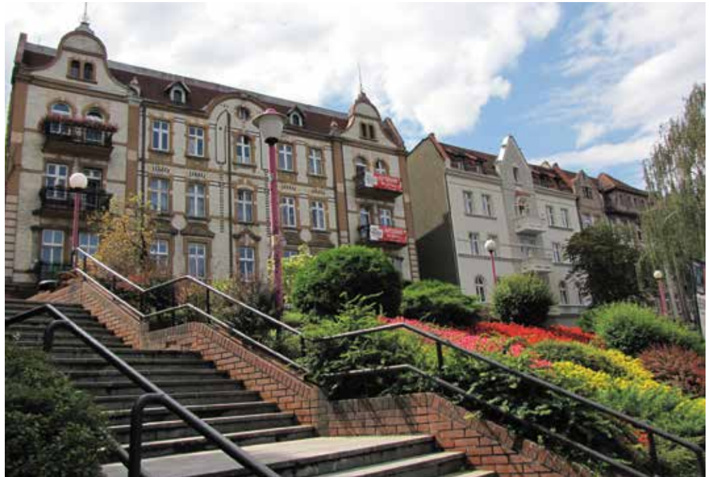
Fragment zabudowy ul. J. Lompy