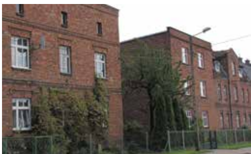
Fragment starej zabudowy przy ul. J. Ziętka

Tekst i zdjęcia: Adam Lapski Przewodnik turystyczny