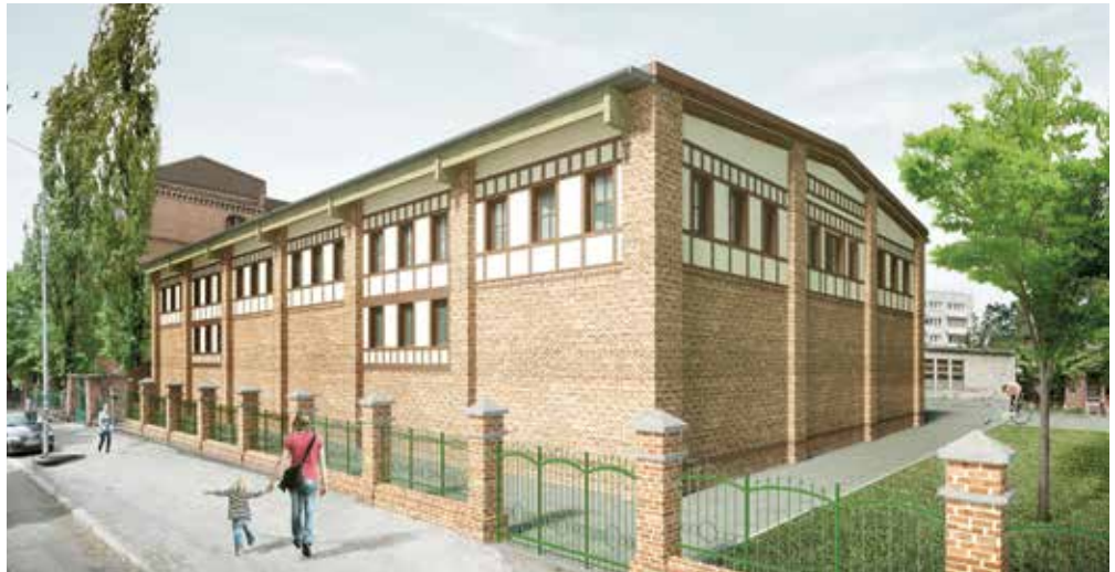
Sala sportowa przy Zespole Szkół Sportowych (obiekt na ukończeniu) – wizualizacja

- Nowym i obecnym przedsiębiorcom oferujemy ulgi podatkowe oraz wszelką pomoc w załatwianiu niezbędnych formalności. Jestem dumny z tego, że nasz urząd jest przyjazny i otwarty dla przedsiębiorców. Stawiamy także na e-usługi i znaczną część spraw urzędowych załatwić można u nas nie wychodząc z biura czy z domu. Od ubiegłego roku cyklicznie organizujemy spotkania dla przedsiębiorców, w ramach których prowadzone są ciekawe wykłady i warsztaty, a także, co stanowi chyba największy atut, można wymienić się dobrymi praktykami lub nawiązać nowe relacje biznesowe. Mysłowice docenione zostały przez deweloperów, którzy chętnie budują na naszych terenach i są doceniani przez mieszkańców, również tych z miast ościennych. Niewątpliwym udogodnieniem dla przedsiębiorców będzie rów-