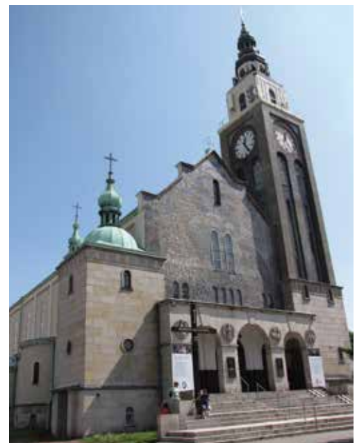
Kościół Matki Boskiej Bolesnej