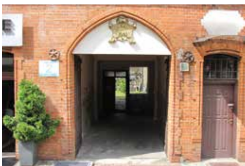
Kamienica przy ul. Mikołowskiej 2 i Oświęcimskiej