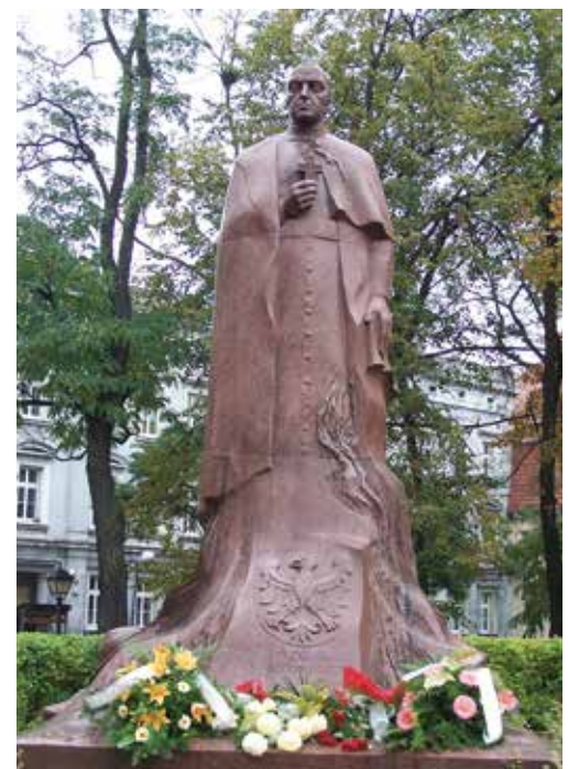
Pomnik kardynała Augusta Hlonda