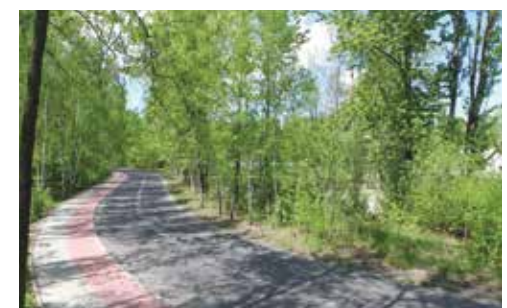
Ul. Stadionowa po remoncie