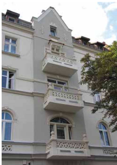
Fragment zabudowy ul. J. Lompy