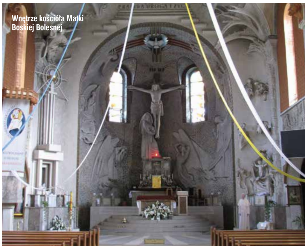
Wnętrze kościoła Matki Boskiej Bolesnej

Dalej udajemy się pod wiadukt kolejowy, aby dojść do ul. Oświęcimskiej i ul. Katowickiej. Z tego miejsca bardzo dobrze widać ciekawą zabudowę kamienic mieszczańskich przy ul. Lompy, pochodzących z końca XIX i początku XX wieku. My skręcamy jednak w lewą stronę ul. Oświęcimskiej, gdzie na narożu z ul. Mikołowską podziwiać można neogotycką kamienicę z 1901 r., wzniesioną z charakterystycznej czerwonej cegły elewacyjnej. Na wysokości pierwszego piętra dostrzeżemy gotycką