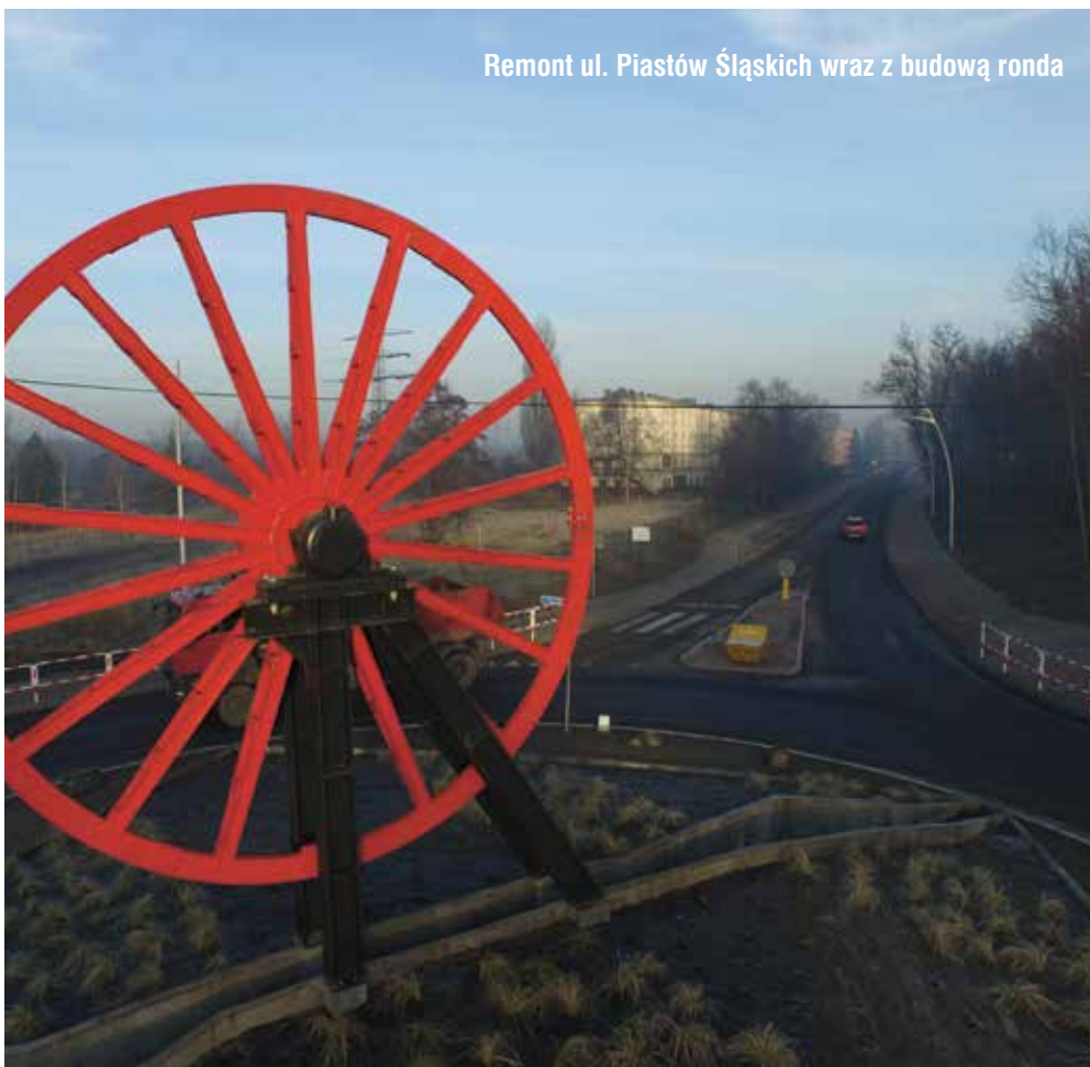
Remont ul. Piastów Śląskich wraz z budową ronda