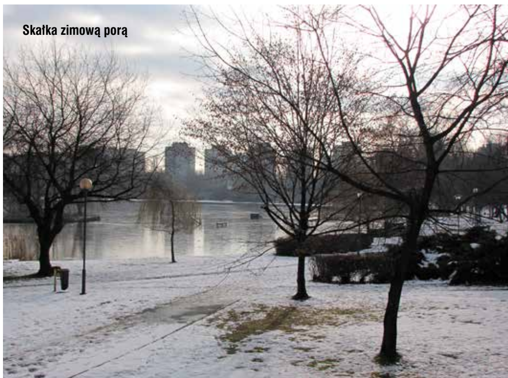
Skałka zimową porą

W dalszej części naszej wędrowki dochodzimy do ul. W. Korfantego, a następnie do skrzyżowania