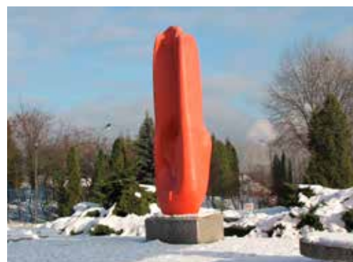
Abstrakcyjna rzeźba zwana Marchewką