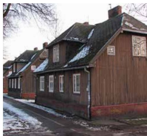
Kolonia domków fińskich przy ul. Chorzowskiej