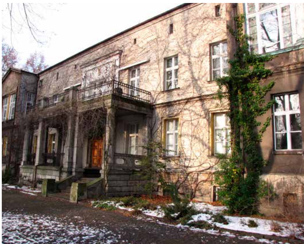
Tzw. Zamek z 1859 r. w parku Heiloo

z ul. Chorzowską. Po prawej stronie widoczna jest szeregowa zabudowa tzw. fińskich domków, pochodzących z okresu międzywojennego. Są to charakterystyczne, parterowe budynki, z użytkowym poddaszem, wykonane z drewna i nakryte dwuspadowym dachem.