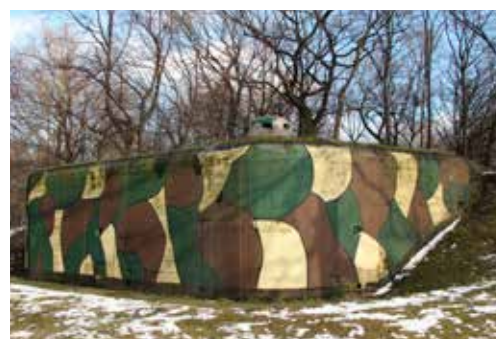
Polski schron bojowy nr 39 w parku Heiloo

Tekst i zdjęcia: Adam Lapski Przewodnik turystyczny