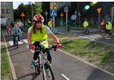
Miasteczko ruchu drogowego wybudowane w ramach Budżetu Obywatelskiego 2016

- Jakie miejsce w planach rozwojowych miasta zajmuje transport publiczny? Co ważnego wydarzyło się w mieście w ostatnim czasie i czy planowane są jakieś kolejne działania?