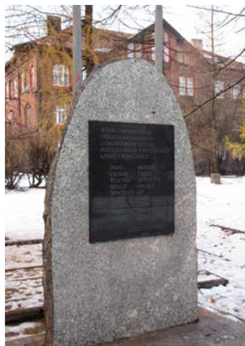
Pomnik ku czci Powstańców Śląskich przy ul. Bytomskiej