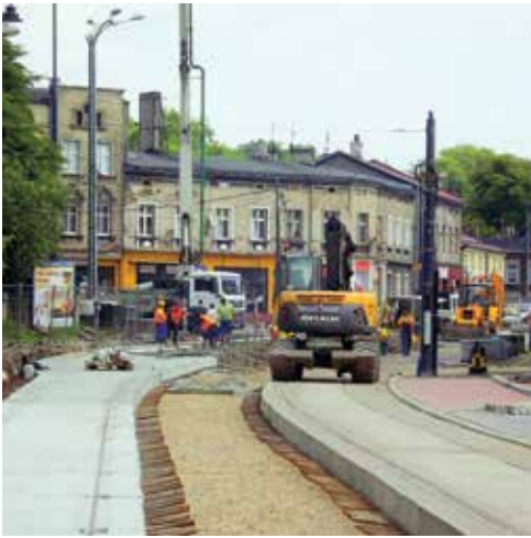
Modernizacja torowisk często obejmuje również infrastrukturę towarzyszącą, zmieniając wygląd całych ulic

też zakup 45 nowych tramwajów. – Nie ukrywam, że czasu na realizację naszego Projektu jest niewiele, bo wszystkie inwestycje powinniśmy zrealizować do końca 2020 roku. Dlatego bez zwłoki przystępujemy do prac – mówi Prezes Zarządu Tramwajów Śląskich S.A. Jako pierwsza rozpocznie się przebudowa infrastruktury tramwajowej wzdłuż ul. Niedurnego w Rudzie Śląskiej na odcinku od ul. Hutniczej do ul. Grochowskiej. Dla tego zadania niebawem zostanie wyłoniony wykonawca robót. Kolejne przetargi są w toku. W 2017 roku rozpoczną się wszystkie zadania w ramach etapu I Projektu B.