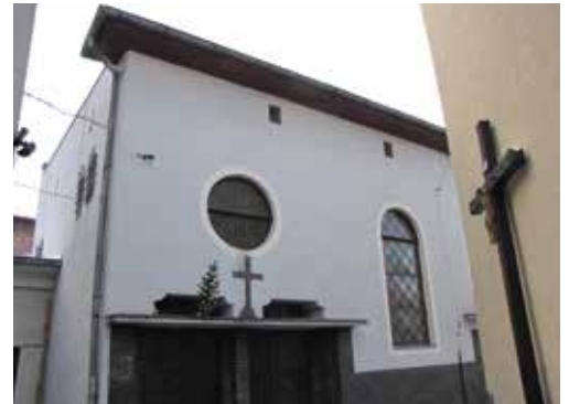
Zabudowa kościoła św. Antoniego przy ul. Rymera

Szybem kolejowym zwiedzający mogą zjechać aż na trzy poziomy kopalni „Guido”. Pierwszy poziom (170) to „Święta Barbara” - o długości trasy 1 km, przebiega przez najstarszą udostępnioną obecnie część kopalni. Obejmuje zabytkowe wyrobiska, komory oraz stajnie dla kopalnianych koni. Trasa, oprócz