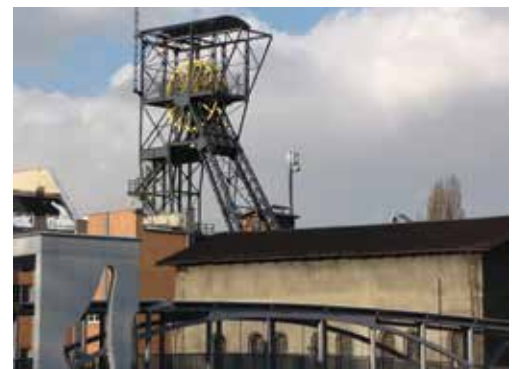
Zabudowa Sztolni Królowa Luiza