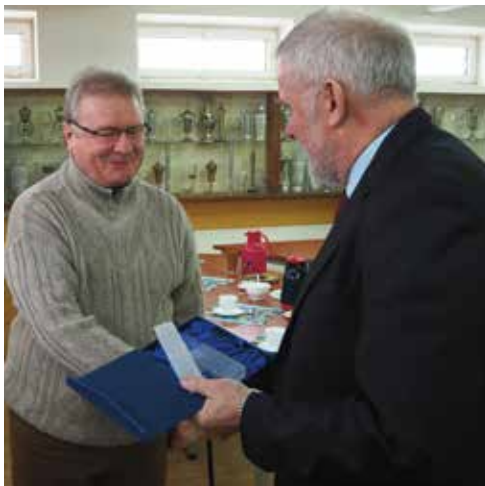
Emerytowani pracownicy otrzymali na pamiątkę tramwaj w szkole