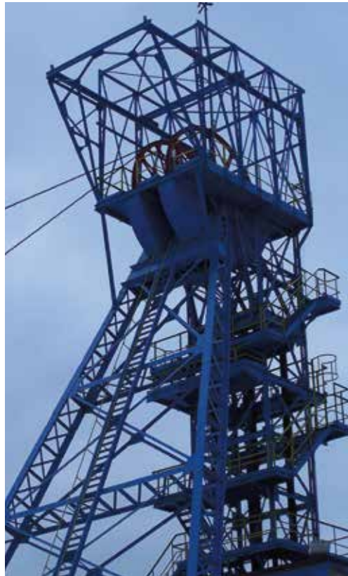
Szyb kopalni Guido

Po zwiedzeniu zabudowań sztolni wracamy do ul. Wolności i wchodzimy w ul. J. Rymera, która doprowadzi nas do ul. 3 Maja. Tam znajduje się druga industrialna atrakcja Zabrze: kopalnia „Guido” (możemy tu również dojechać tramwajem, linią nr 3). Po drodze mijamy starą i nową zabudowę