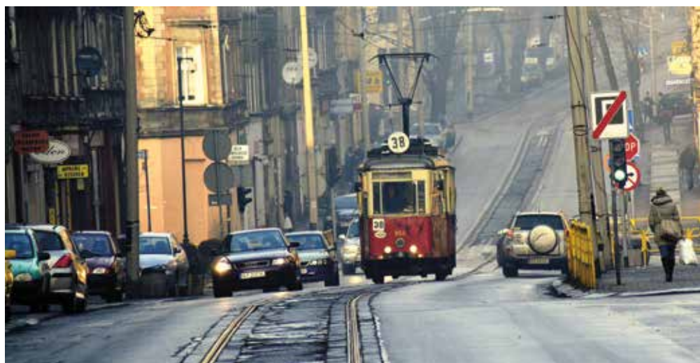
Bytom, ul. Piekarska - kultowa bytomska linia zostanie gruntownie zmodernizowana

Projekt podzielony został na dwa etapy, a przewiduje realizację inwestycji w 10 miastach Aglomeracji obejmując modernizacją ok. 100 km torowisk. Ponadto w ramach Projektu wybudowane zostaną trzy nowe odcinki linii tramwajowych, o łącznej długości toru ok. 20 km. Spółka planuje