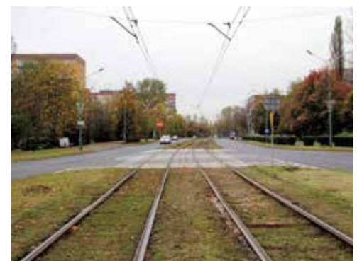
W Sosnowcu zmodernizowane zostanie m.in. torowisko wzdłuż ul. Piłsudskiego