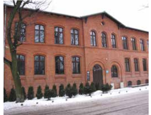
Budynek przy ul. Jordana 59

prezentacji trudu pracy górniczej, ukazuje również postać i kult św. Barbary – patronki górników. Drugi poziom (320) to okazja do dwugodzinnej wędrowki kopalnianymi chodnikami, pozwalającej poznać rozwój techniki górniczej - od końca XIX wieku aż do czasów współczesnych. Największą atrakcją tej trasy jest przejażdżka górniczą kolejką. Natomiast poziom trzeci (355) to tzw. Szychta. Tutaj zwiedzający mogą niemal na własnej skórze poczuć czym jest praca górnika. W górniczym stroju roboczym trzeba pokonać 1,5 km podziemnej trasy. Eskapada ta trwa ok. 3,5 godziny. Zapewniam, że jest to niezapomniana i jedyna w swoim rodzaju przygoda!