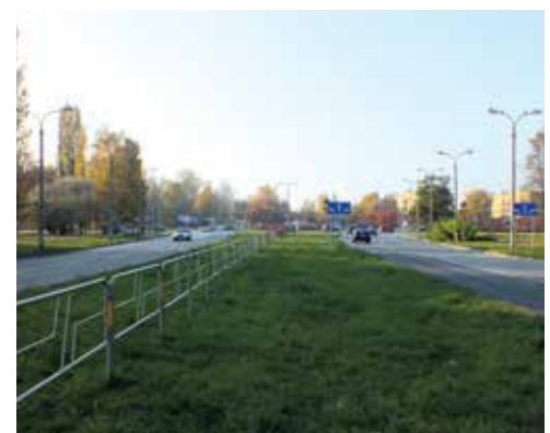
Sosnowiec Zagórze - miejsce na linię tramwajową

W ramach tego Projektu Tramwaje Śląskie chcą kupić 45 nowych tramwajów. Wszystko to ma zostać zrealizowane do końca 2020 roku.