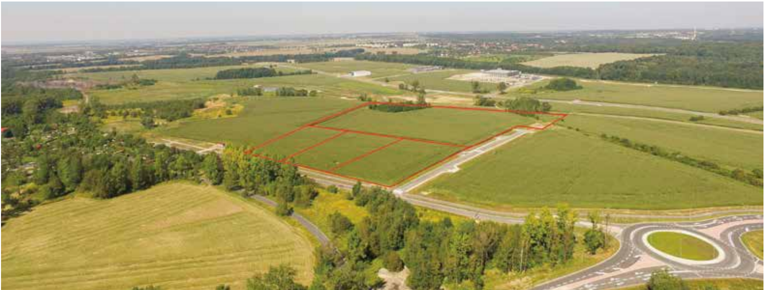
Zabrzańska strefa ekonomiczna jest przygotowana dla inwestorów. Działa tam 10 firm. Polska Agencja Informacji i Inwestycji Zagranicznych przyznała tytuł "Grunt na medal 2016"

- Jakie miejsce w planach rozwojowych miasta zajmuje transport publiczny? Co ważnego w tej dziedzinie wydarzyło się w mieście w ostatnim czasie i czy planowane są jakieś kolejne działania?