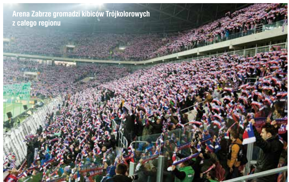
Arena Zabrze gromadzi kibiców Trójokolorowych z całego regionu