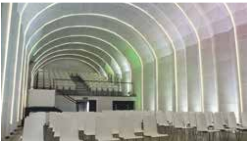
W kopalni Guido odbywają się koncerty i spektakle m.in. Festiwal im. Krzysztofa Pendereckiego. Strefa K8 na poziomie 320 to także pub

- Rozbudowujemy i poprawiamy infrastrukturę drogową. Przypomnę, że w ostatnich latach zabrzański samorząd dofinansowywał budowę Drogowej Trasy Średnicowej kwotą 41 mln zł. Ta arteria poprawiła jakość komunikacji w mieście i regionie. Łącząc Gliwice z Katowicami jest atutem dla inwestorów. Zaznaczę, że między innymi przy DTS-ce plany biznesowe realizuje firma IKEA, która już w tym roku rozpocznie budowę centrum handlowego. Realizując projekt modernizacji wodociągów także odbudowywaliśmy drogi w dzielnicach. W aglomeracji górnośląskiej, która cechuje się wysokim stopniem zurbanizowania i gęstością zaludnienia, mieszkańcy oczekują sprawnie funkcjonującej komunikacji publicznej.