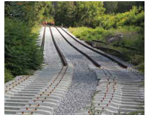
Budowa wydzielonej linii dwutorowej