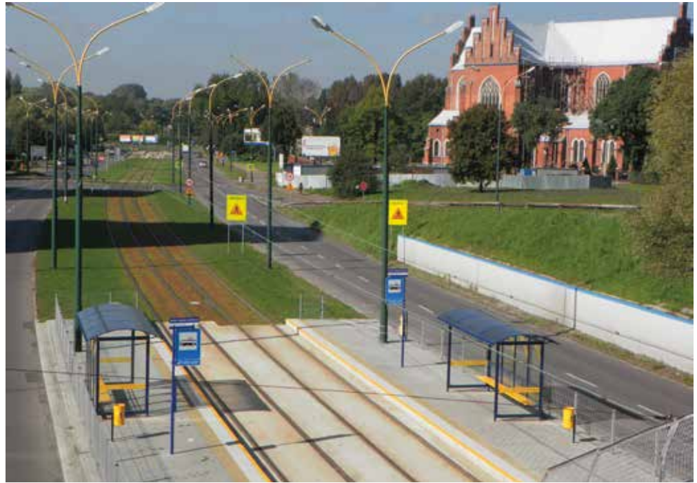
Zmodernizowana linia do Zagórze w Sosnowcu. Ta linia zostanie przedłużona

W ramach „Zintegrowanego projektu modernizacji i rozwoju infrastruktury tramwajowej w Aglomeracji Śląsko-Zagłębiowskiej wraz z zakupem taboru tramwajowego” Tramwaje Śląskie planują również zakup nowych tramwajów. Powołany przez Zarząd Spółki zespół przetargowy przygotowuje specyfikację istotnych warunków zamówienia dla przetargu na zakup nowych tramwajów. W planie jest zakup trzech różnych typów tramwajów – długich, średnich i krótkich, ze względu na to, iż właśnie takie są potrzeby taborowe Spółki.