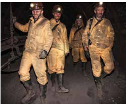
Zwiedzając poziom 355 kopalni Guido turyści otrzymują specjalną odzież ochronną

Poprawiamy też jakość infrastruktury dla komunikacji publicznej. W ostatnich latach wyremontowaliśmy dworzec PKP. Remontujemy torowiska tramwajowe. W zintegrowanym systemie transportu tramwaje pełnią bardzo istotną rolę. Są zarazem najbardziej przyjazną dla środowiska naturalnego formą komunikacji zbiorowej. Dlatego podejmujemy inwestycje, które przekładają się na wzrost poziomu świadczonych usług. Prace modernizacyjne wpłynęły na poprawę bezpieczeństwa pasażerów oraz na podniesienie niezawodności tej formy komunikacji. Będziemy kontynuować ten kierunek rozwoju komunikacji miejskiej.