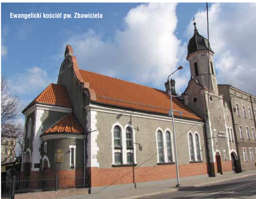
Ewangelicki kościół pw. Zbawiciela

Tekst i zdjęcia: Adam Lapski Przewodnik turystyczny