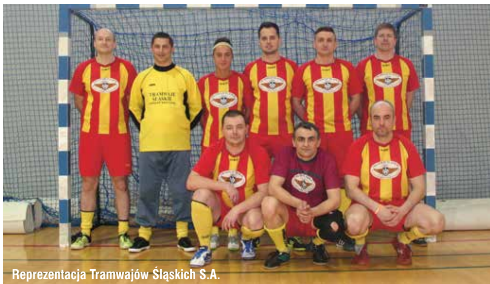
Reprezentacja Tramwajów Śląskich S.A.

Kryzys przyszedł w meczu numer trzy. Rywalem Tramwajów Śląskich był PKM Sosnowiec, który bez straty gola wygrał dwa pierwsze mecze.