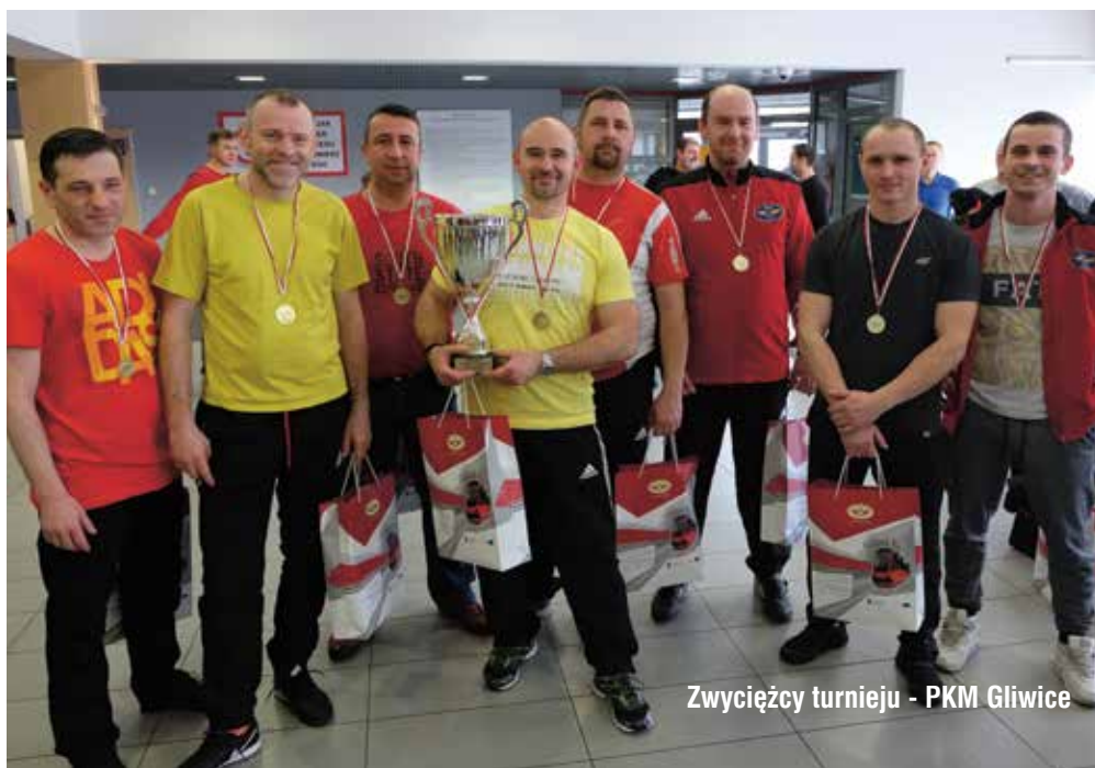
Zwycięcy turnieju - PKM Gliwice