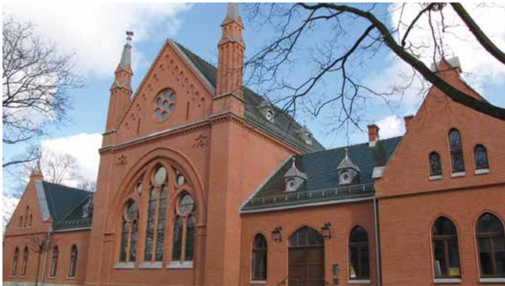
Dom Pamięci Żydów Górnośląskich

Kształtująca się przez wieki wielokulturowość - zgodne współistnienie różnych narodów, kultur i religii - to cecha charakterystyczna naszego regionu. Ślady tej różnorodności można dostrzec na przykład w Gliwicach, gdzie do dziś obok siebie żyją katolicy, protestanci, a także niewielka grupa Żydów.