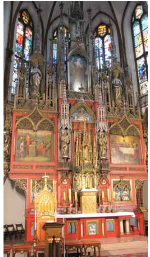
Ołtarz w nowym kościele św. Bartłomieja