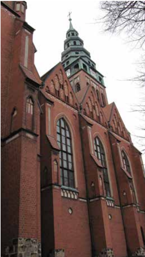
Nowy kościół św. Bartłomieja

W 1815 roku ewangelicy otrzymali na własność kościół św. Barbary (dzisiaj katolicki kościół garnizonowy), wybudowali dom opieki (w 1905 roku), żłobek, 3 przedszkola, dwie stacje diakonis oraz ośrodek wypoczynkowy w Sudetach. Od 1872 roku do parafii należą aż cztery szkoły. Trzeba dodać, że w XIX wieku pręźnie działały dwa Towarzystwa: Ewangelickie Towarzystwo Mężczyzn „Wartburg” oraz Towarzystwo Kobiet. W 1994 roku założono Ewangelickie Towarzystwo Edukacyjne, które obecnie prowadzi ewangelickie gimnazjum, liceum oraz szkołę podstawową im. Alberta Schweitzera. Parafia liczy obecnie 509 osób, a praca duszpasterska prowadzona jest również na terenie dzielnic Łabędy, Żerniki oraz Pyskowice. Parafia wchodzi w skład diecezji ka-