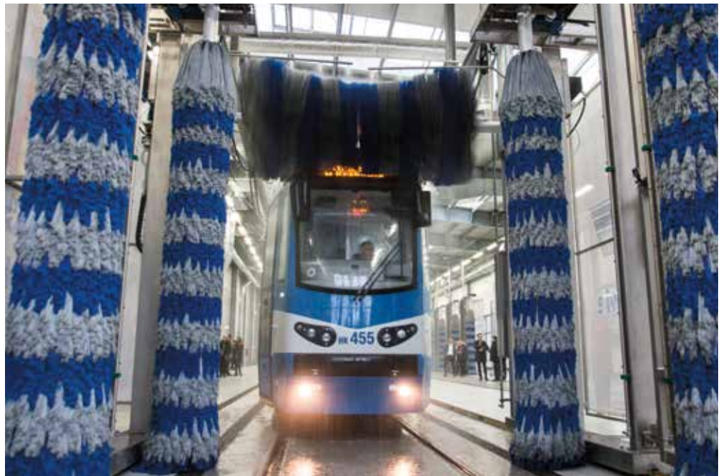
Nowoczesna myjnia w Stacji Obsługi Tramwajów Nowa Huta

- Podobnie jak w innych dużych polskich miastach także u nas sporo utrudnień w funkcjonowaniu