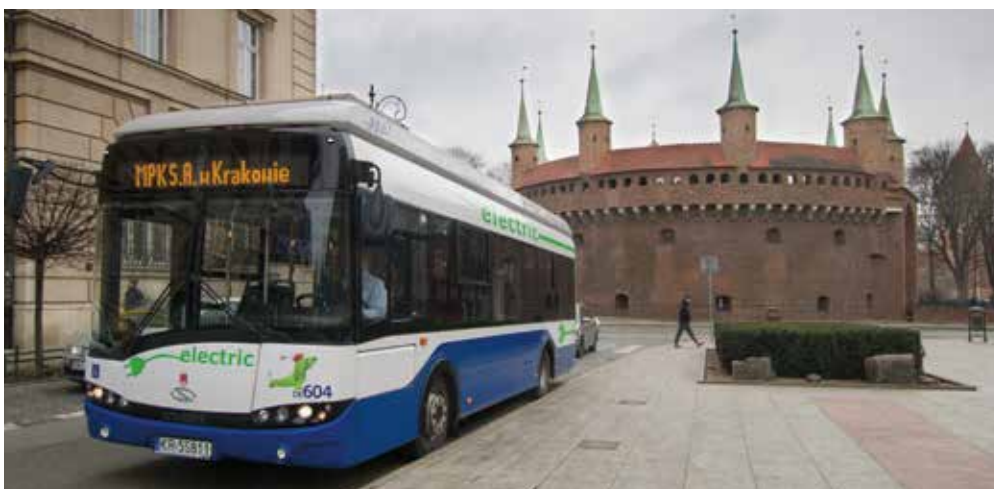
Elektryczny autobus wyjeżdżający na linię nr 154

- W naszych planach jest zakup kolejnych nowoczesnych autobusów i tramwajów. Na lata 2019-2020 zaplanowaliśmy dostawy 35 nowoczesnych tramwajów o długości ponad 30 metrów. Mamy także zamiar kontynuować wymianę taboru autobusowego, tak aby był w 100 proc. ekologiczny. MPK SA z władzami miasta Krakowa zadeklarowało także udział w rządowym projekcie e-Bus, który zakłada dofinansowywanie zakupu miejskich autobusów elektrycznych. 20 lutego 2017 roku w Warszawie, w siedzibie Ministerstwa Rozwoju, podpisano List Intencyjny w sprawie współpracy w zakresie rozwoju elektromobilności. W ramach rządowego programu e-Bus krakowski przewoźnik planuje zakup 100 autobusów elektrycznych. Ponieważ liczba autobusów elektrycznych w Krakowie systematycznie się zwiększa planujemy budowę kolejnych stacji ładowania tych pojazdów za pomocą pantografu w pięciu lokalizacjach na terenie miasta. Wszystkie powinny być gotowe pod koniec 2017 roku. Kontynuujemy także modernizację Stacji Obsługi Tramwajów w Nowej Hucie. Na początku 2017 roku zakończyła się tam budowa nowoczesnej myjni, a wkrótce zostanie tam oddana tokarka podtorowa i dodatkowe tory.