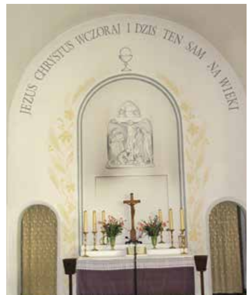
Ołtarz w kościele pw. Zbawiciela