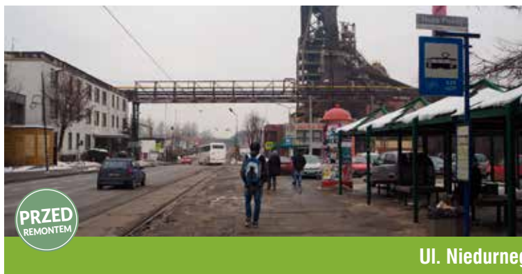
Ul. Niedurnego, Huta Pokój

Efekty inwestycji na pewno odczuwalne są również dla mieszkańców okolicznych budynków. Jak zwykle przy okazji tego typu modernizacji, przeprowadzone zostały specjalistyczne pomiary hałasu i drgań emitowanych przez przejeżdżające tramwaje. Badania przeprowadzono przed rozpoczęciem prac oraz po ich zakończeniu w dwóch punktach.