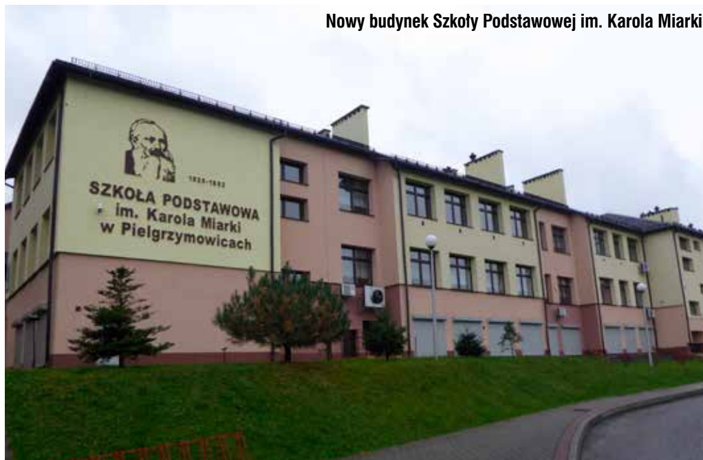
Nowy budynek Szkoły Podstawowej im. Karola Miarki

Kolejnym ważnym miejscem na mapie atrakcji Pielgrzymowice jest drewniany kościółek pw. św. Katarzyny Aleksandryjskiej. Sama pielgrzymowicka parafia datuje się na XIV wiek, a najstarsze zapiski o niej pochodzą z 1335 roku. W XVI i XVII wieku parafia była przejściowo w rękach protestantów, którzy użytkowali miejscowy kościół aż do 1654 roku. W latach 1674–1675 cieśle Andrzej Werner i Błażej Duda wybudowali drewniany kościół, o konstrukcji zrębowej, na ceglany podmurówaniu. Kościół orientowany jest na osi wschód-zachód, na rzucie niepełnego krzyża łacińskiego (brak prawego ramienia – kaplicy bocznej), z pięciobocznie zamkniętym prezbiterium. Nawa jest prostokątna, z sufitem pokrytym polichromią kasetonową zaprojektowaną przez Pawła Stellera. Ściany budowli szalowane są deskami. W 1746 roku od strony zachodniej dobudowana została wieża dzwonnicy w konstrukcji słupowej, z hełmem namiotowym krytym gontem. Na dachu nad nawą umieszczona została osmioboczna wieżyczka z latarnią na sygnaturkę, wykonana