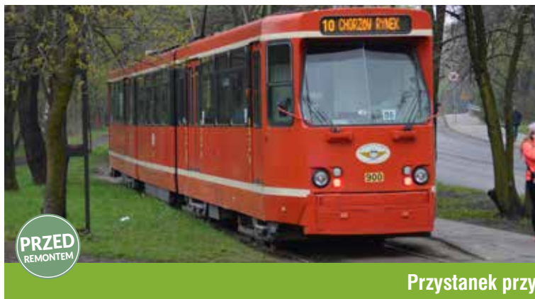
Przystanek przy ul. Grochowskiej