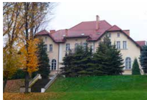
Dawny pałac rodziny Reitzensteinów, którzy byli właścicielami Pielgrzymowic od połowy XIX wieku.