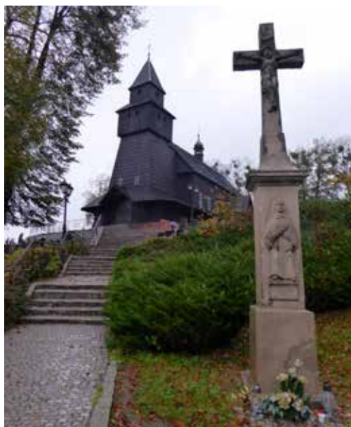
Drewniany kościół pw. św. Katarzyny Aleksandryjskiej wybudowany został w latach 1674–1675. Budowla utrzymana jest w stylu barokowym.

w konwencji barokowej. Również wewnątrz kościoła utrzymane jest w stylu barokowym. Uwagę zwraca ołtarz główny z obrazem patronki kościoła - św. Katarzyny - i schodzącej do niej Matki Bożej z Dzieciątkiem. Przed św. Katarzyną rozłożona jest otwarta księga z napisem: „Dziewictwem mądra i siłą obfita, odwagą skuteczna”. Nad postaciami widoczny jest anioł trzymający palmę męczeństwa i wieniec chwały. Po bokach obrazu stoją figury Najświętszego Serca Jezusa oraz Najświętszego Serca Maryi. Ołtarz zwieńczony został symbolem „Opatrzności Bożej”, po bokach którego ustawiono dwa klęczące anioły. W wyniku przebudowy kościoła w latach 1908-1911, od strony północnej pojawiła się kaplica boczna oraz zakrystia, a od strony południowej wykonano tzw. łóżę kolatorską. W kaplicy po lewej stronie (północnej) znajduje się późnobarokowy ołtarz z obrazem Matki Bożej Różańcowej, pochodzący z XIX wieku, a także obraz z przedstawieniem Hołdu Trzech Króli. Dopelnieniem wystroju kaplicy jest barokowa chrzcielnica oraz figury przy ołtarzu: Matki Bożej Wspomożenia Wiernych (strona lewa), Chrystusa Króla (strona prawa) oraz św. Barbary, św. Antoniego i św. Floriana. Po przeciwnej stronie kaplicy,