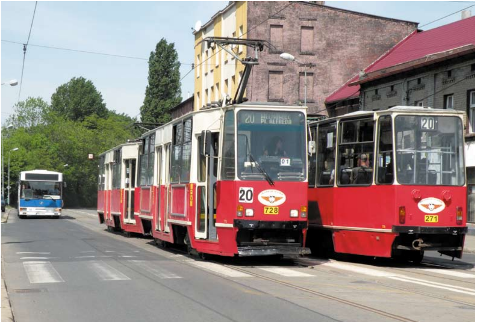
Fot. Wojciech Zawadzki