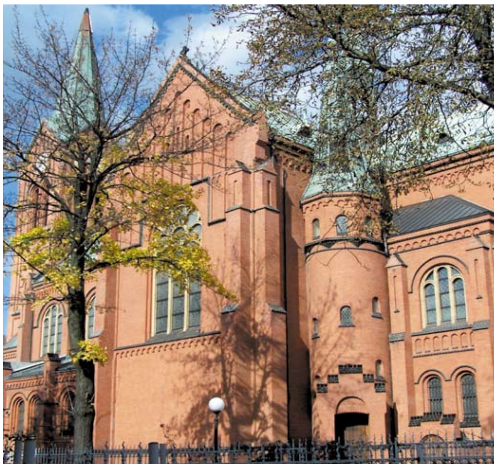
Kościół pw. Najświętszego Serca Pana Jezusa w Bytomiu-Szombierkach.