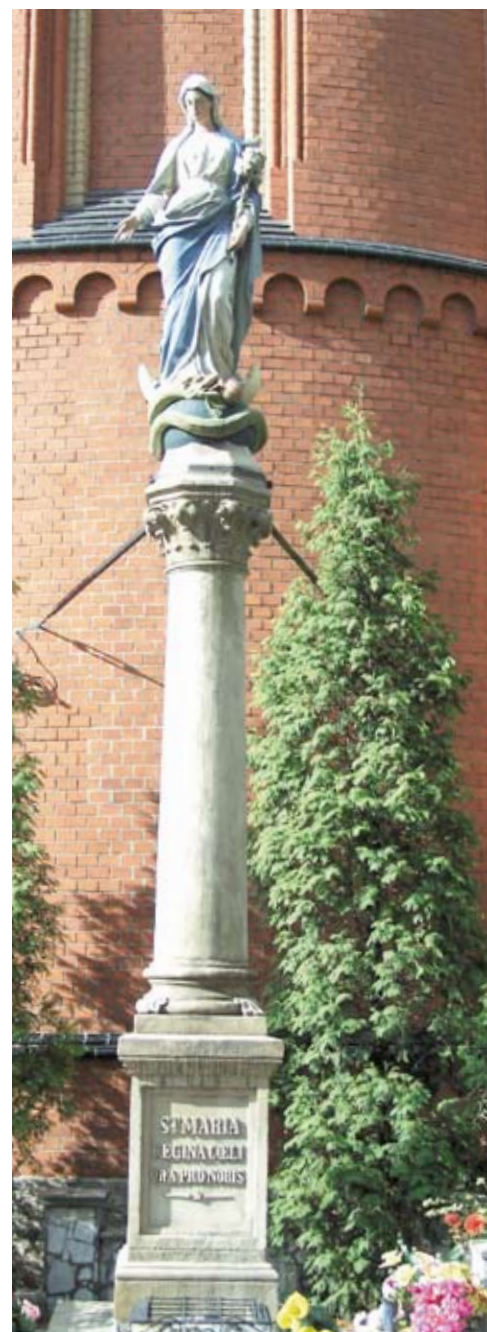
Kolumna maryjna przed kościołem.

Tekst i zdjęcia: Adam Lapski przewodnik turystyczny