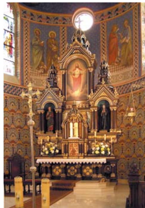
Ciekawe, bogato zdobione ołtarze dębowe.