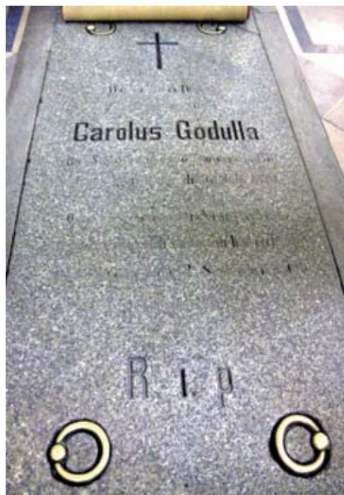
Płyta nagrobna Karola Goduli.