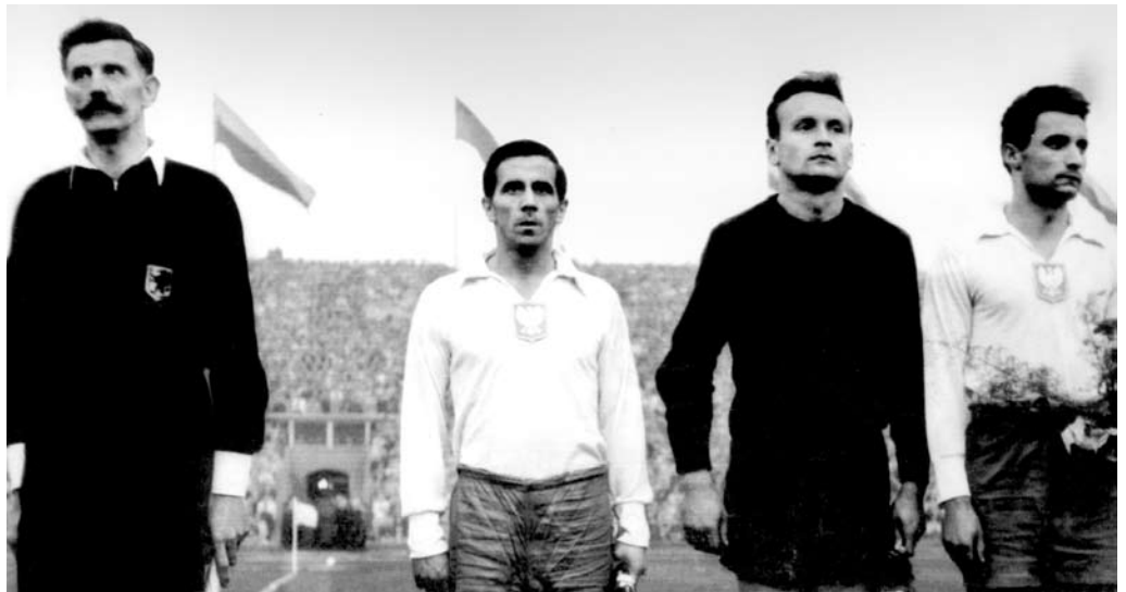
... i przed pamiętnym meczem reprezentacji Polski z drużyną ZSRR na Stadionie Śląskim 20 października 1957 roku.