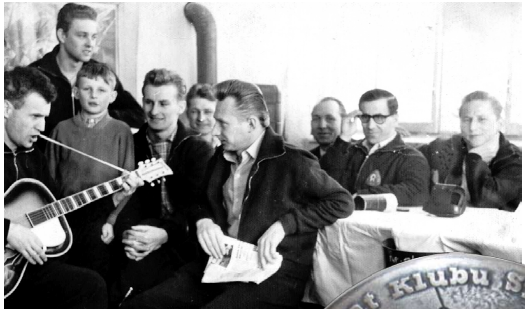
Legendarny piłkarz (w okularach), podczas spotkania towarzyskiego z przyjaciółmi z chorzowskiego Ruchu.

Gerard Cieślik także liczył na pełny sukces, ale końcowy wynik przyjął spokojnie: - To jeszcze nie jest najlepsza „ruchowska” forma, ale zaczyna się coś z tego naprawdę dobrze kleić. Myślę, że jest duża szansa na to, że drużyna będzie się