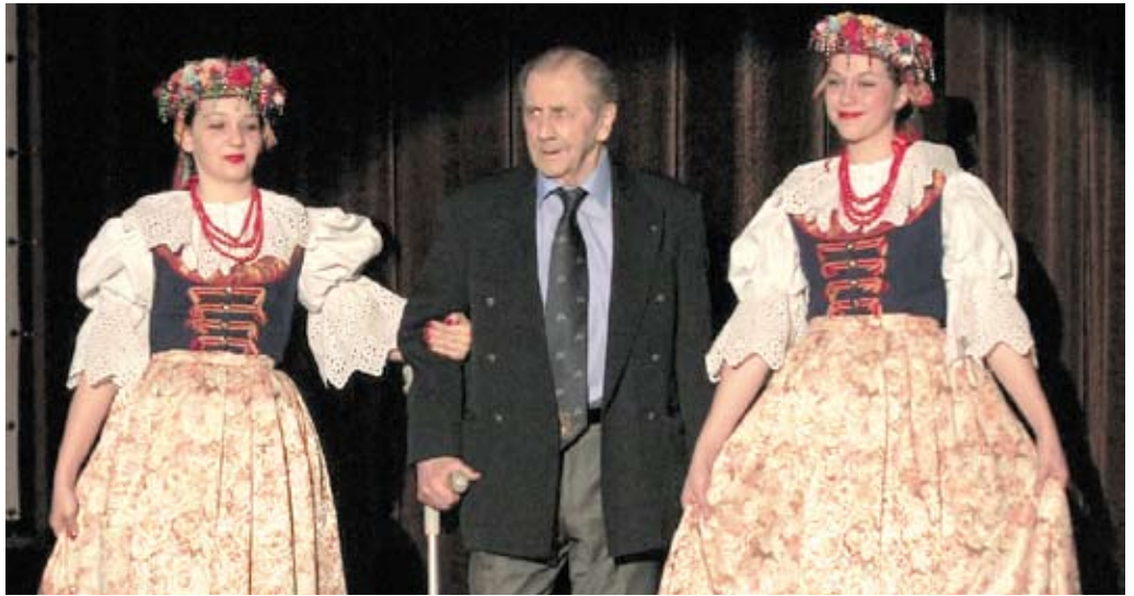
Gerard Cieślik podczas swojego benefisu, 27 kwietnia 2012 roku...

W uznaniu zasług dla polskiej piłki Gerard Cieślik przyjęty został do elitarnego Klubu Wybitnego Reprezentanta, jako jedyny, który nie spełnił formalnego wymogu sześćdziesięciu spotkań piłkarskich w barwach narodowych. 29 kwietnia 2012 roku Gerard Cieślik świętował 85 rocznicę urodzin. Dwa dni wcześniej, z tej okazji zorganizowano w Chorzowie jego benefis.