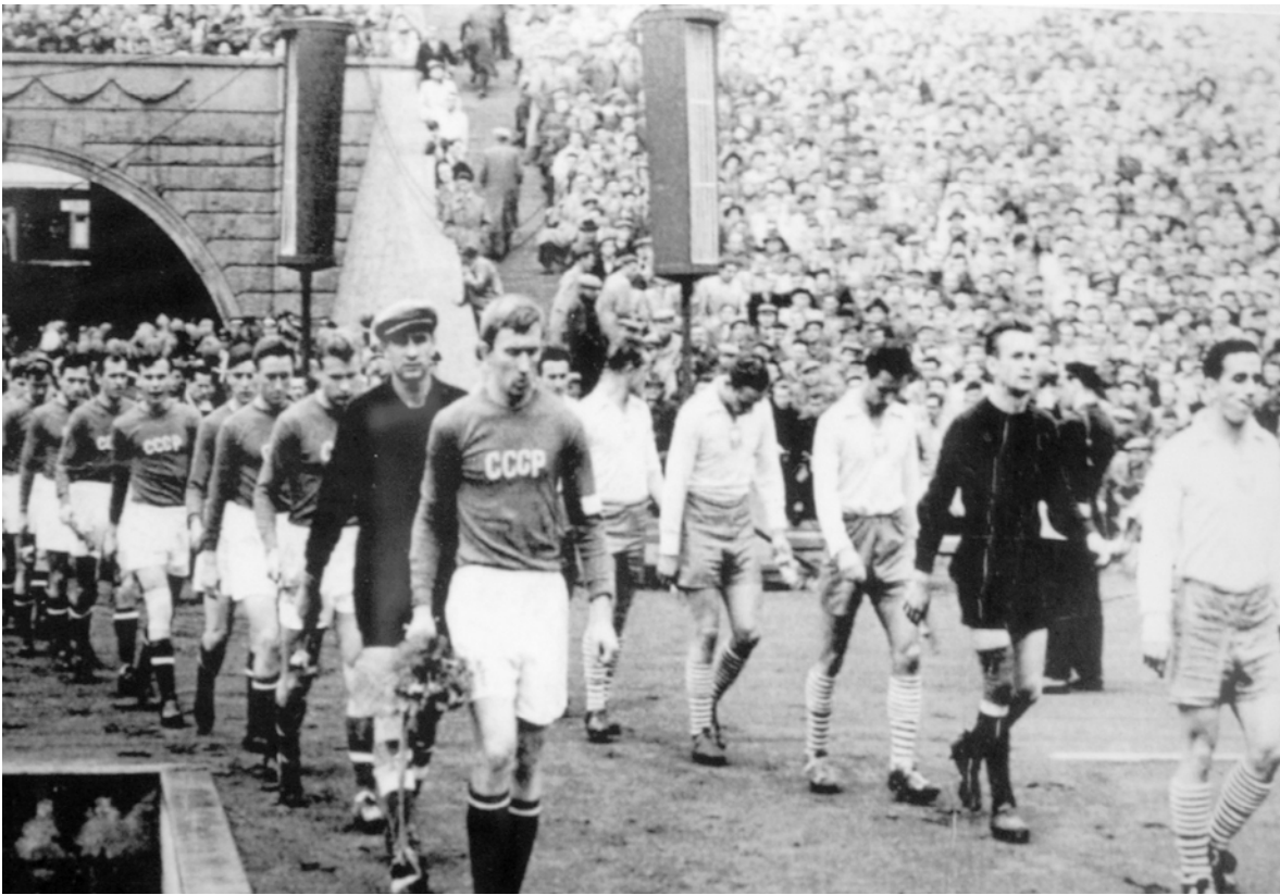
Drużyny Polski i ZSRR na murawie Stadionu Śląskiego.