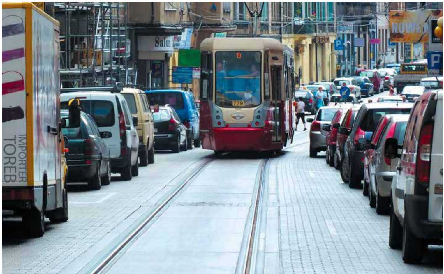
Dokonano już odbioru końcowego przebudowanego torowiska, peronu oraz nawierzchni jezdni ul. Moniuszki.