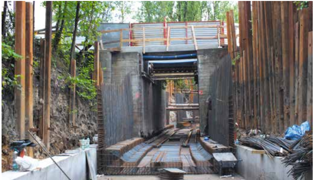
Ruda Śląska - torowisko w wąwozie ul. Zabrzeńska.

Andrzej Bywalec Dyrektor ds. inwestycji Tramwajów Śląskich Pełnomocnik Zarządu ds. realizacji Projektu