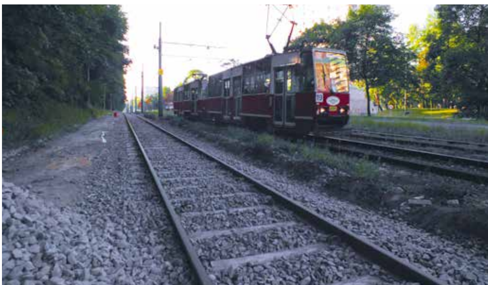
Katowice - torowisko w rejonie Paku Śląskiego.

Ponadto na początku sierpnia ogłosiliśmy postępowanie przetargowe dla zadań: Modernizacja torowiska w ciągu ul. Gliwickiej od przystanku tramwajowego „Lisa” do granic miasta Katowice z Chorzowem. Przebudowa sieci trakcyjnej” (zadanie nr 11a), „Modernizacja torowiska wbudowanego w jezdnię ul. Wolności od granicy ze Świętochłowicami do ul. Bolesława Chrobrego w Chorzowie” (zadanie nr 62), „Modernizacja torowiska tramwajowego na przejeździe tramwajowym w ul. Brackiej w Katowicach”.