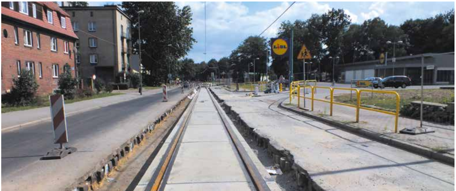
Zabrze, ul. 3-go Maja (powyżej) oraz Sosnowiec, rejon pętli tramwajowej „Zagórze” (poniżej).