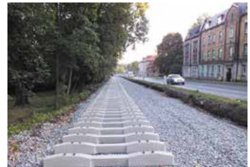
Przebudowa torowiska wzdłuż ul. Świętochłowickiej i Łagiewnickiej na odcinku od granic miasta Świętochłowice do Zamłynia w Bytomiu.