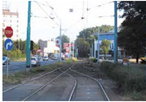
Modernizacja torowiska na odcinku od przystanku Chorzów AKS do przystanku Chorzów Chopina.

sieci trakcyjnych, wymiana nawierzchni torów i rozjazdów oraz wykonanie odwodnienia. Skanska przebudowuje sieci kolidujące, a na zakończenie przygotowuje zagospodarowanie i urządzenie terenu.