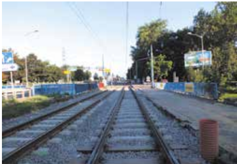
Prace przy montażu torowiska wzdłuż Parku Śląskiego.

W ramach wymienionych kontraktów do najważniejszych zadań należy: wdrożenie nowej organizacji ruchu, wykonanie rozbiórki, przebudowa istniejących torowisk, dostosowanie