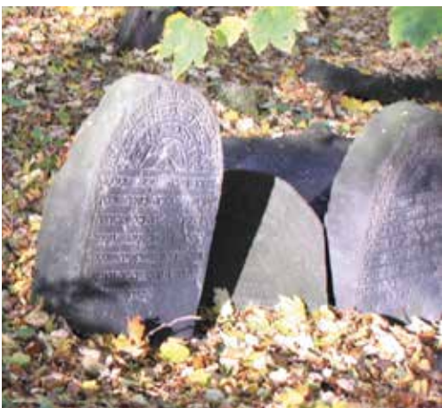
Kirkut (powyżej) oraz cmentarz i kaplica św. Tomasza (obok).