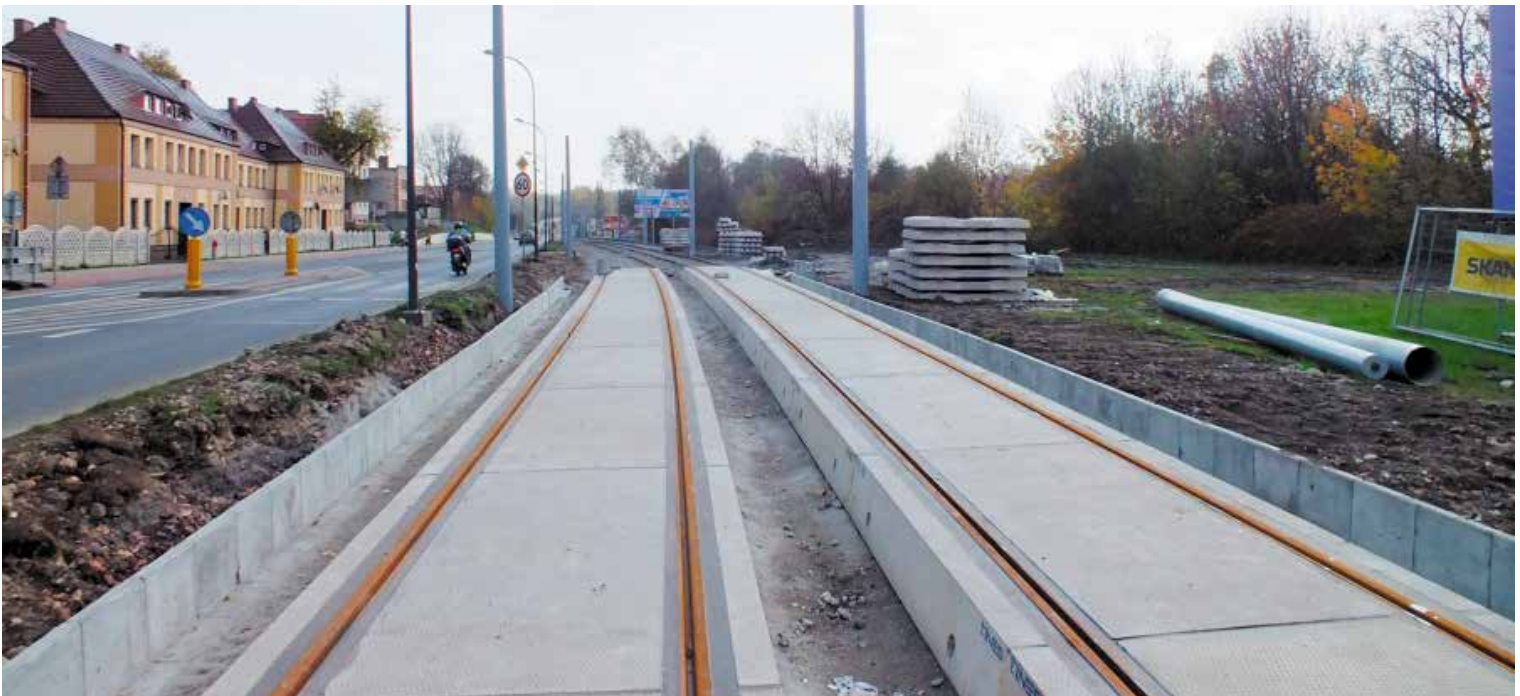
Powstały przejazdy w ul. Fabrycznej, Spacerowej, Szyby Rycerskie oraz w rejonie ul. Bernardyńskiej w Bytomiu.