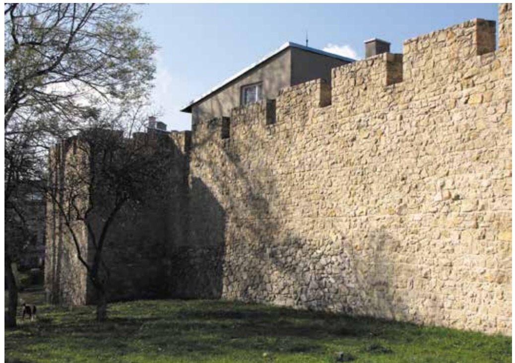
Mury przy ul. Zawale i Modrzejowskiej.

Tekst i zdjęcia: Adam Lapski przewodnik turystyczny