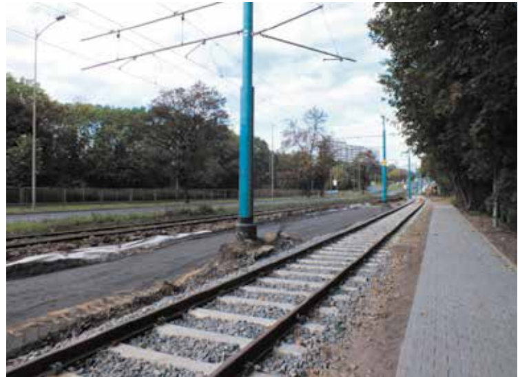
Trwają m.in. intensywne prace obejmujące torowiska w rejonie Parku Śląskiego.

Wszystkie wymienione w tekście inwestycje, związane z Projektem pn. Modernizacja infrastruktury tramwajowej i trolejbusowej w Aglomeracji Górnośląskiej wraz z infrastrukturą towarzyszącą realizowanym przez Tramwaje Śląskie S.A., są współfinansowane przez Unię Europejską ze środków Funduszu Spójności w ramach Programu Infrastruktura i Środowisko.