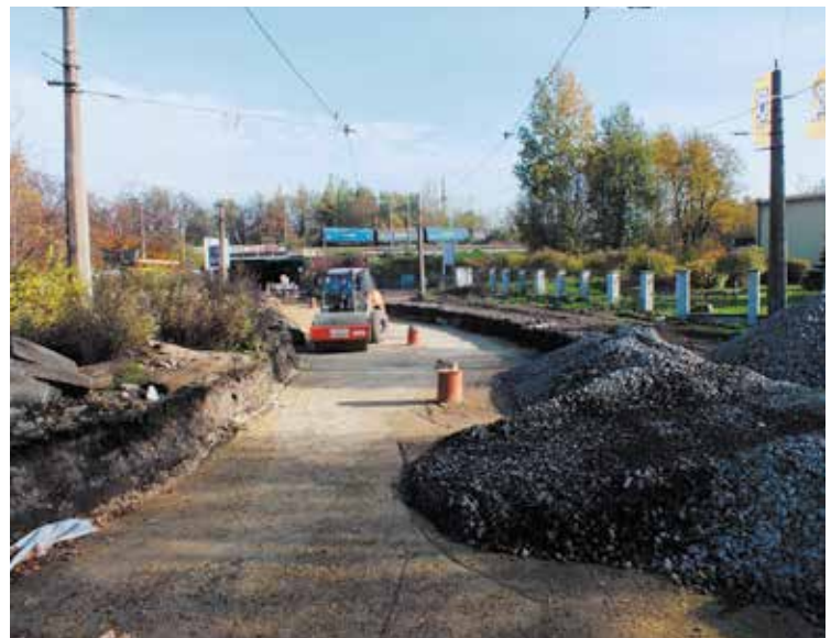
Na odcinku wzdłuż ul. Dworcowej i K. Goduli w Rudzie Śl. trwają prace ziemne.