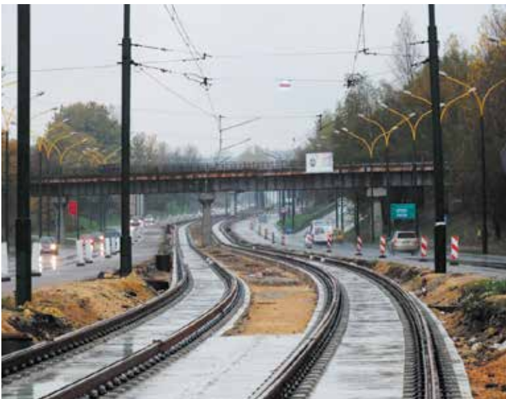
Trwa m.in. montaż torowiska w Sosnowcu na odcinku od Środuli Osiedle do tunelu.