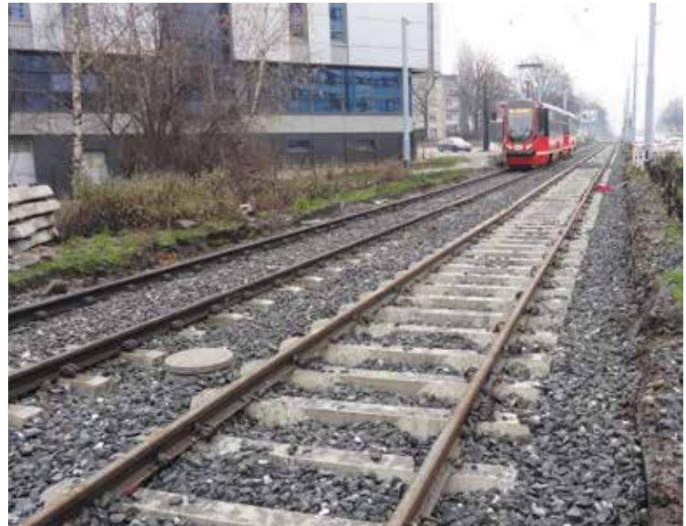
Między przystankami AKS a Chopina w Chorzowie Tramwaje kursują już po dwóch nowych torach.

Wszystkie wymienione w tekście inwestycje, związane z Projektem pn. Modernizacja infrastruktury tramwajowej i trolejbusowej w Aglomeracji Górnośląskiej wraz z infrastrukturą towarzyszącą realizowanym przez Tramwaje Śląskie S.A., są współfinansowane przez Unię Europejską ze środków Funduszu Spójności w ramach Programu Infrastruktura i Środowisko.