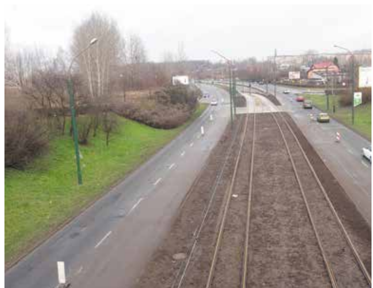
W Sosnowcu tramwaje linii nr 15 jeżdżą już po nowym torowisku od skrzyżowania z ul. Żeromskiego do pętli w Zagórz.