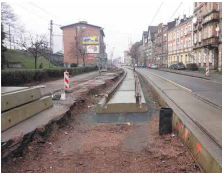
Drugi nowy tor wbudowany w ul. Armii Krajowej w Chorzowie.