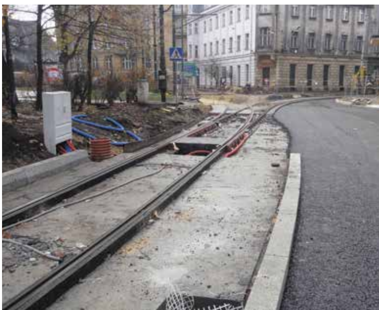
Pl. Wolności w Katowicach – prace trwają już po stronie południowej.