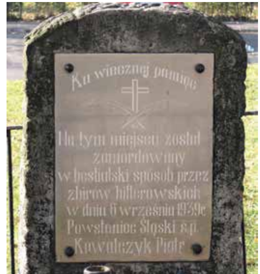
Pomnik ku czci powstańca śląskiego.