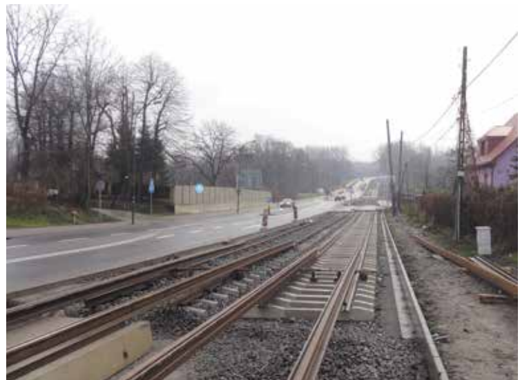
Budowa dwutorowej linii w Bytomiu wzdłuż ul. Łagiewnickiej i Świętochłowickiej.