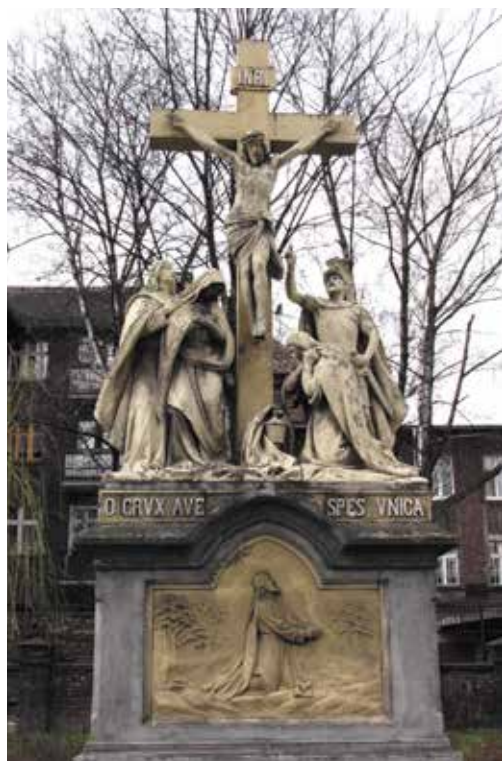
Grupa ukrzyżowania przed kościołem św. Piotra i Pawła.

ale niegdyś swoją siedzibę miała tu dyrekcja kopalń i hut Donnersmarcków. Następnie skręcamy w ulicę Wodną, przechodzimy przez ulicę Wyzwolenia (najstarsza ulica miasta, dawniej – ulica Długa), ulicę Szkolną i ulicę ks. Kubiny, gdzie funkcjonuje miejskie targowisko z odbudowaną halą targową. Wracając ulicą Szkolną do ulicy Katowickiej, przy nr 15 zobaczyć można zabudowania dawnej remizy ochotniczej straży pożarnej. Dalej przechodzimy do ulicy Dworcowej. W budynku pod numerem 14 do 2012 roku swoją siedzibę miało Muzeum Miejskie (wcześniej była tu szkoła ewangelicka założona w 1888 roku). Obecna siedziba muzeum, przemianowanego na