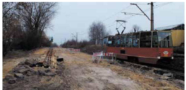
Katowice, ul. Sosnowiecka.