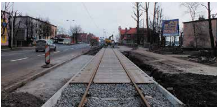
Ruda Śląska, ul. Zabrzeńska.