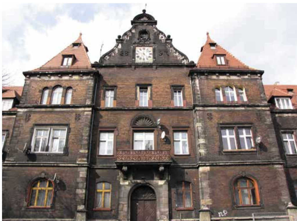
Dawna dyrekcja kopalni i hut Donnersmarcków.

Tekst i zdjęcia: Adam Łapski Przewodnik turystyczny