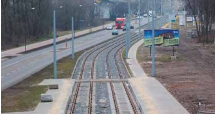
Bytom, ul. Łagiewnicka.

Tramwaje Śląskie S.A posiadają już 61 zmodernizowanych wagonów typu 105 N, z czego 16 wagonów zmodernizowanych zostało przez Zakład Usługowo Remontowy Tramwajów Śląskich S.A. w Chorzowie, a pozostałe przez Konsorcjum firm Modertrans i MPK Łódź. W kolejnych miesiącach 2014 r. modernizację w ZUR w Chorzowie przejdzie jeszcze 14 wagonów.