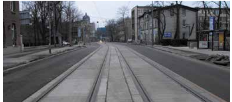
Chorzów, ul. Armii Krajowej.

Dyrektor ds. inwestycji Tramwajów Śląskich Pełnomocnik Zarządu ds. realizacji Projektu