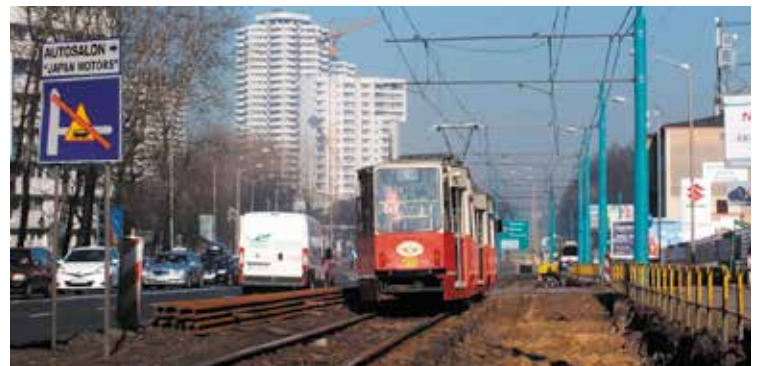
Katowice, ul. Chorzowska.