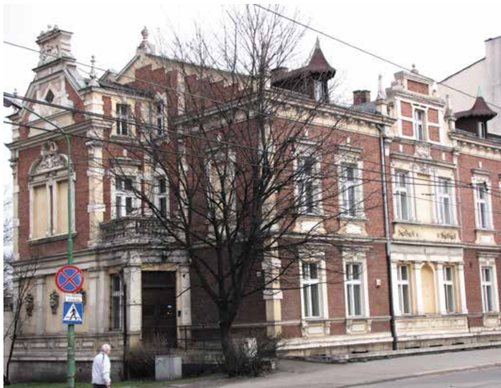
Dawna willa Wallisów ul. Katowicka.

ale niegdyś swoją siedzibę miała tu dyrekcja kopalń i hut Donnersmarcków. Następnie skręcamy w ulicę Wodną, przechodzimy przez ulicę Wyzwolenia (najstarsza ulica miasta, dawniej – ulica Długa), ulicę Szkolną i ulicę ks. Kubiny, gdzie funkcjonuje miejskie targowisko z odbudowaną halą targową. Wracając ulicą Szkolną do ulicy Katowickiej, przy nr 15 zobaczyć można zabudowania dawnej remizy ochotniczej straży pożarnej. Dalej przechodzimy do ulicy Dworcowej. W budynku pod numerem 14 do 2012 roku swoją siedzibę miało Muzeum Miejskie (wcześniej była tu szkoła ewangelicka założona w 1888 roku). Obecna siedziba muzeum, przemianowanego na