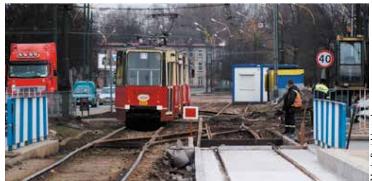
Sosnowiec, ul. 3 Maja i ul. Żeromskiego.

Wszystkie wymienione w tekście inwestycje, związane z Projektem pn. Modernizacja infrastruktury tramwajowej i trolejbusowej w Aglomeracji Górnośląskiej wraz z infrastrukturą towarzyszącą realizowanym przez Tramwaje Śląskie S.A., są współfinansowane przez Unię Europejską ze środków Funduszu Spójności w ramach Programu Infrastruktura i Środowisko.