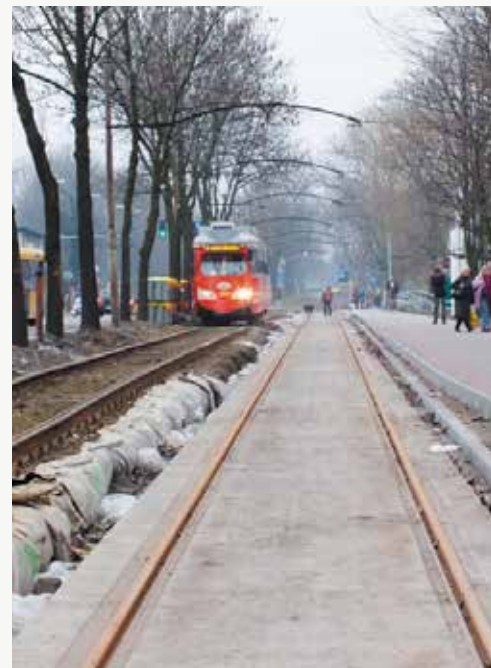
Zabrze, ul. Wolności.