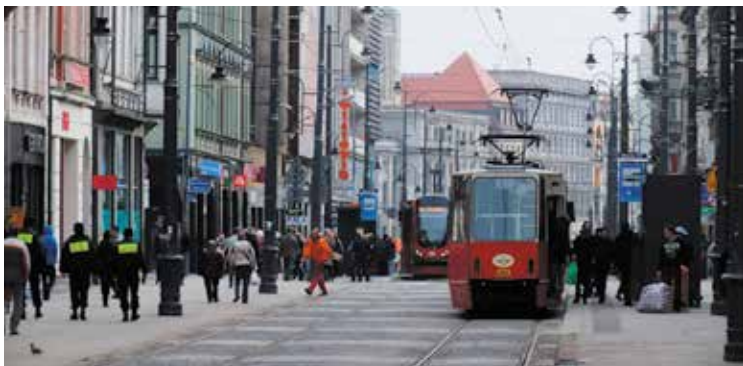
Katowice, ul. 3 Maja.