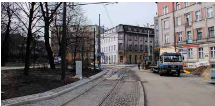
Katowice, pl. Wolności.