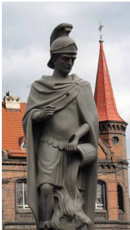
Figura św. Floriana przy kościele św. Piotra i Pawła. W tle klasztor boromeuszek.

Podążając dalej ulicą Katowicką, warto zwrócić uwagę na budynek pod numerem 30, wzniesiony w 1897 roku. Obecnie jest to dom mieszkalny,