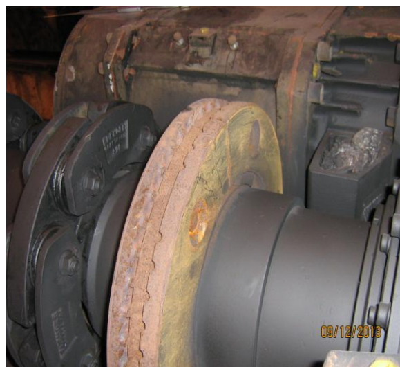
Zdjęcia tarczy wózka napędowego.