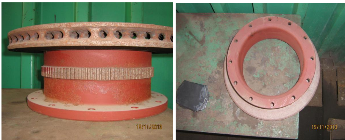
Zdjęcia tarczy wózka tocznego.

3. DANE TECHNICZNE TARCZY WÓZKA NAPĘDOWEGO: