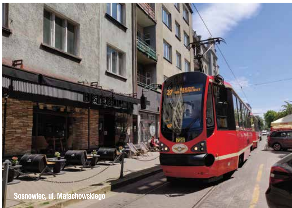
Sosnowiec, ul. Małachowskiego

Miejski Zarząd Ulic i Mostów w Chorzowie wdrożył czasową zmianę organizacji ruchu drogowego na odcinku między skrzyżowaniem z ul. Dąbrowskiego i skrzyżowaniem z ul. Dobrodzieńską, wyłączając ten fragment ul. Hajduckiej z ruchu. W ramach tego etapu pracami objęte zostaną chodnik oraz część jezdni ulicy położone po stronie budyn-