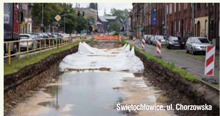
Świętochłowice, ul. Chorzowska