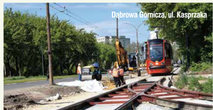
Dąbrowa Górnicza, ul. Kasprzaka