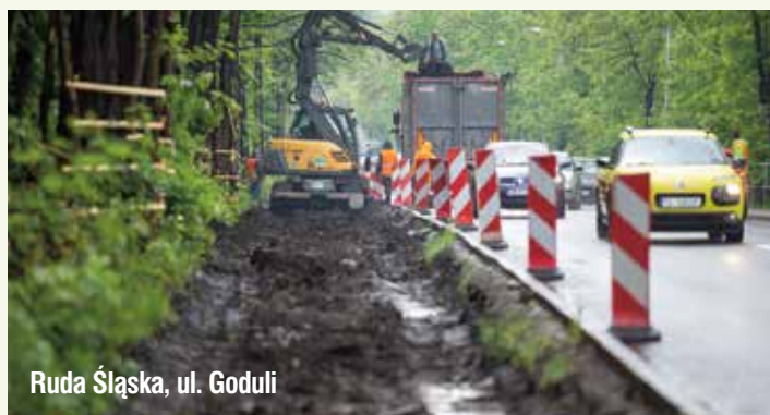
Ruda Śląska, ul. Goduli