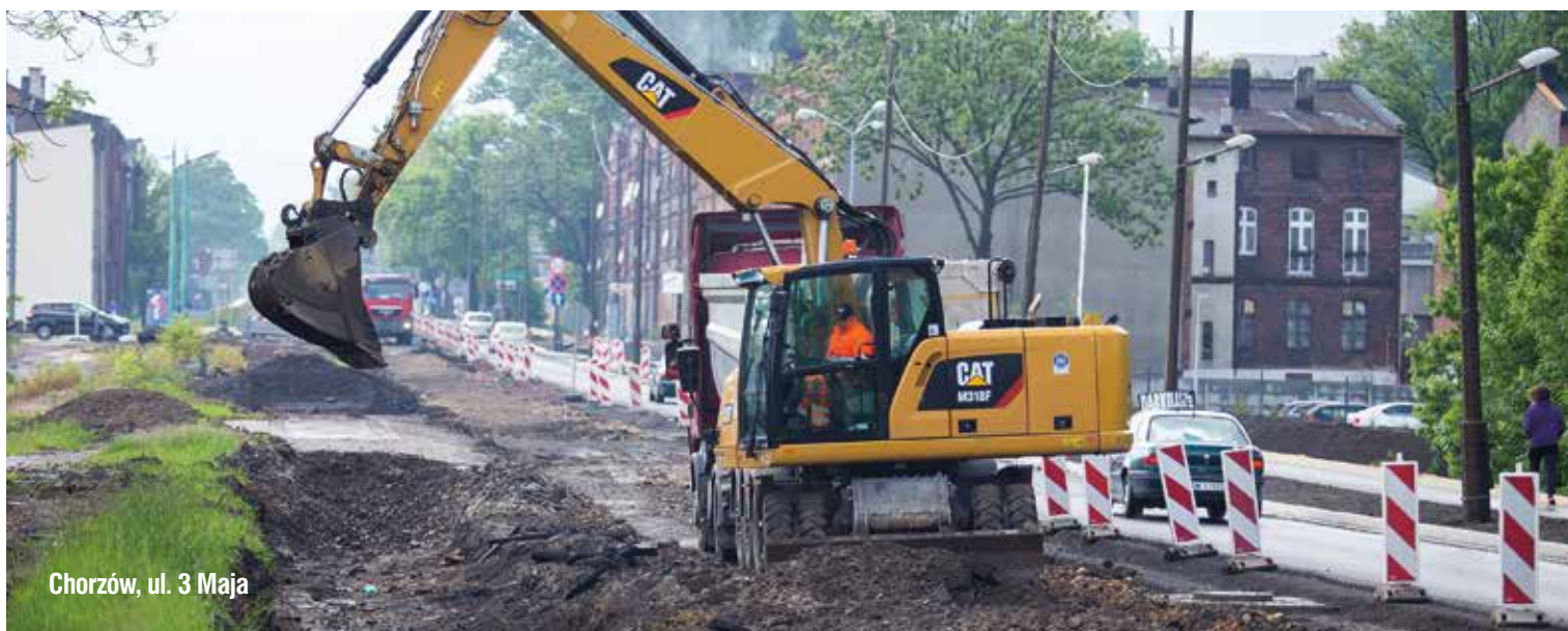
Chorzów, ul. 3 Maja