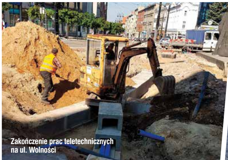
Zakończenie prac teletechnicznych na ul. Wolności