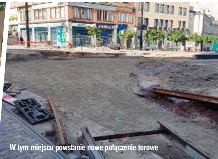
W tym miejscu powstanie nowe połączenie torowe

Coraz bliżej do zakończenia modernizacji torowisk tramwajowych w centrum Zabrze. Od 18 maja 2020 r. tramwaje kursują między Zaborzem a Biskupicami po nowym torowisku. Tymczasowo jednak jest to linia nr 29, a nie nr 5. Rozpoczynające się prace w Biskupicach powodują bowiem, że „piątka” od Bytomia dojeżdża tylko do pętli Biskupice.