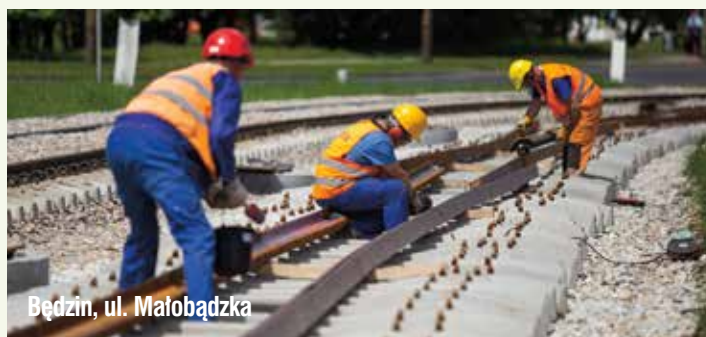
Będzin, ul. Małobądzka