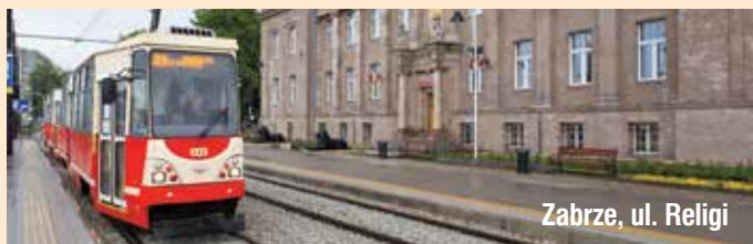
Zabrze, ul. Religi