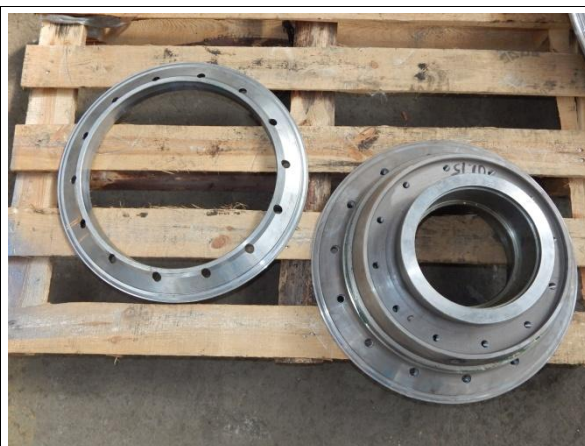
Piasta i pierścień dociskowy piasty koła wózka tocznego