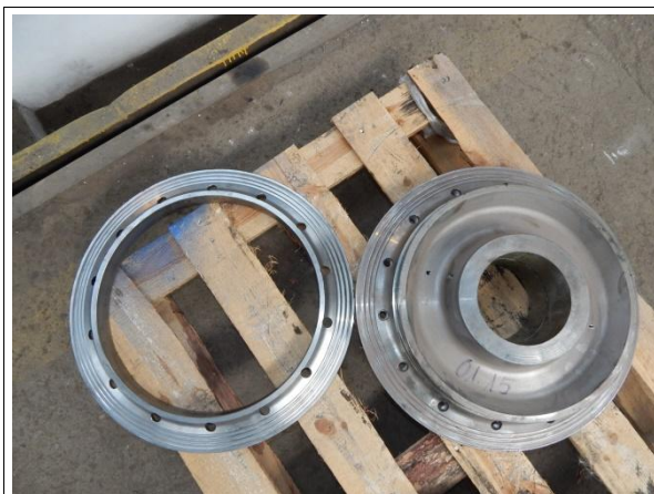
Piasta i pierścień dociskowy piasty koła wózka napędowego